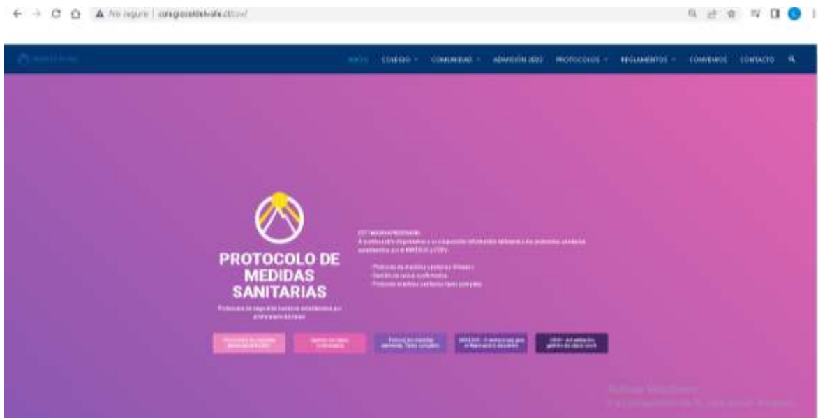
*imagen protocolo página web

En nuestra página web institucional se encuentran las actividades e información relevante de nuestro establecimiento educacional, destacándose la difusión de los protocolos de desinfección y limpieza, como los protocolos referidos a gestión de casos COVID